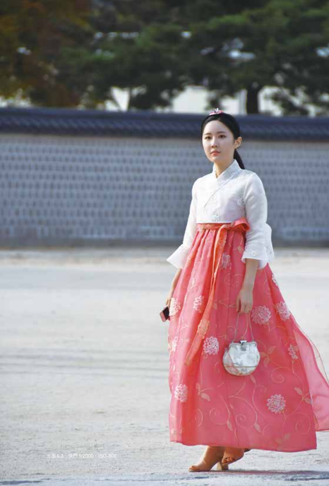
光圈6.3 · 快门 1/2000 · ISO-800