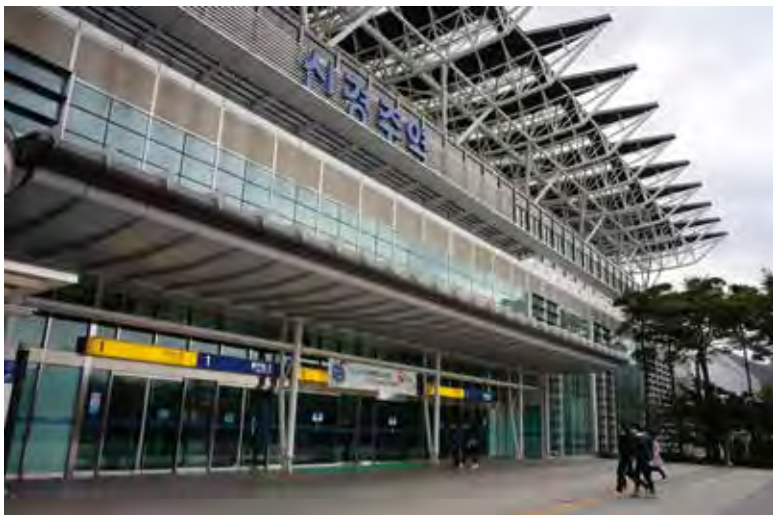
光圖 5.6 · 快門 1/250 · ISO-500