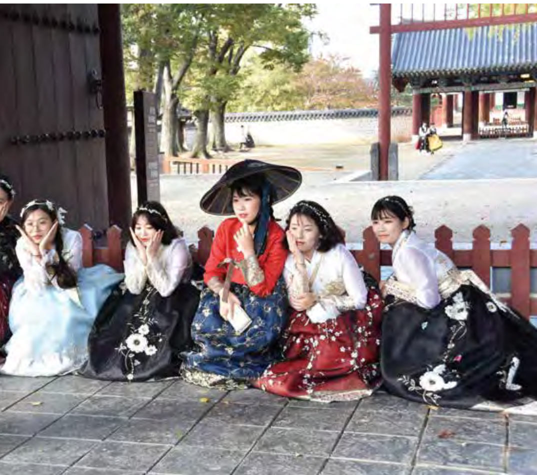
光圈 6.3 · 快門 1/160 · ISO-500