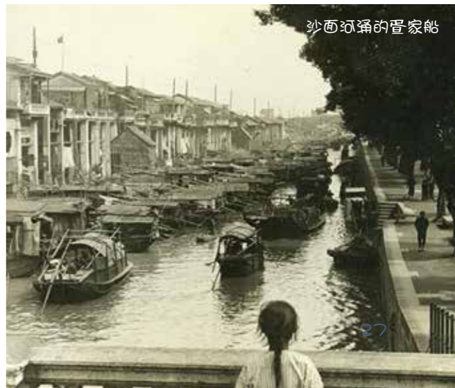
沙面河涌的盪家船

盪家人與陸上人有明顯的文化差異。例如，盪家人出海捕魚前都要拜媽祖，祈求風平浪靜。去盪家做客，忌踏門檻，吃飯時碗、匙不能反扣在桌上，夾菜時手心不能向下，吃魚時不能把魚身翻轉。因這些動作預示着“翻，沉，擱淺”。而坐姿也忌兩腳懸空，免得“不到埠”。