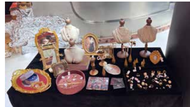
▲ At ART collection 有很多小飾物。

上海文化中，其中一個關鍵是里弄文化，許多本土上海人是在里弄間拉扯長大，里弄的特色是甚麼？煙火味、接地氣，也可以是時髦、摩登。園區通過微型露台和錯落階梯，色彩鮮艷而豐富的空間，即保留了工業風屬性，也充滿色彩繽紛的基因。