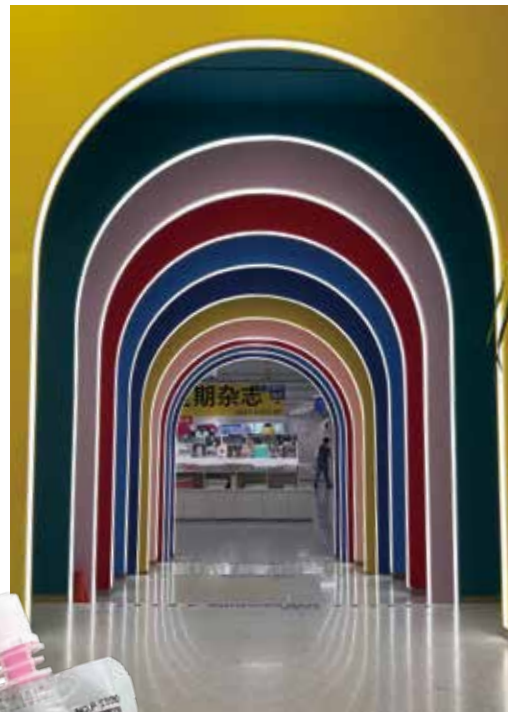
▲ 彩虹門是大家來到必定打卡的地方。

這裏有約 1,000 平方米具特色的「以色彩主義為概念」的集合體驗店，由幸福集薈和馬利畫材首次跨界聯合打造，旨在把馬利的品牌符號和文化價值持續傳遞給城市和年輕一代。