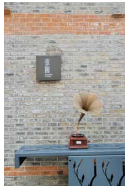
▼ 這裏的細緻位做得很足，常常吸引年輕人來打卡遊覽。