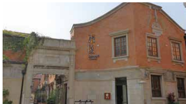
▲ 灰紅磚的搭配，門框是方形石條，裝飾的鐵藝欄杆及巴洛克式的窗框門樓，有着中西合璧的特色。

舊建築色彩以磚砌紅色為主，鑲嵌着精緻水泥灰雕，線條簡潔大氣。歷時三年修繕的張園吸引了頂級奢侈品牌如 Dior、江詩丹頓、LV 等入駐，在一棟棟石庫門樓建築的包圍下，襯托出滿滿的時尚和氣派。