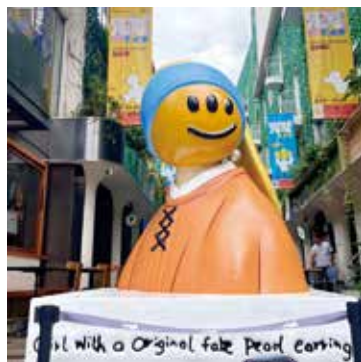
▲ 在創意園迎接大家的是這個既巨型又可愛搞怪的「戴珍珠耳環的少女」。