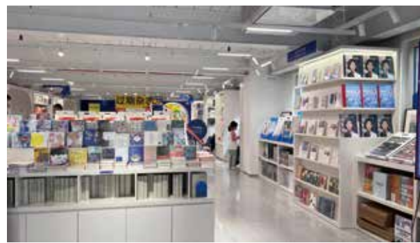
◀ 有關設計的書籍和雜誌。

2 樓是國貨品牌「馬利」和「幸福集營」跨界打造的潮流市集，除了馬利牌美術用品，還匯集了眾多設計師的作品：精品、香薰、招牌服飾、文具等等，也有少量刊物。