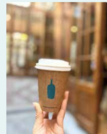
▲ 咖啡平均售 RMB33 到 RMB50。