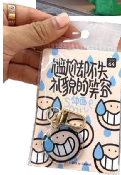
◀ 這個「尷尬卻不失禮貌的笑容」鎖匙扣太正，才 RMB15 一個，入手幾個送給不同朋友。

上海文化中，其中一個關鍵是里弄文化，許多本土上海人是在里弄間拉扯長大，里弄的特色是甚麼？煙火味、接地氣，也可以是時髦、摩登。園區通過微型露台和錯落階梯，色彩鮮艷而豐富的空間，即保留了工業風屬性，也充滿色彩繽紛的基因。