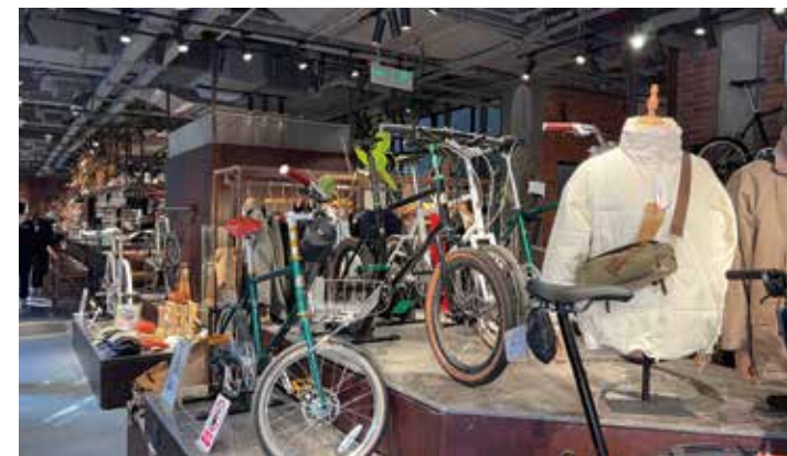
▲ 張園只有兩、三家餐飲，其中「Re 而意自行車」（茂名北路 200 號 W9-1C）有逛的（單車零件）、有吃的、有喝的，是非常有趣的組合。