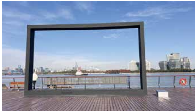
▲ 自然風景配個電影框，是上海精緻又別開生面的浪漫場景。