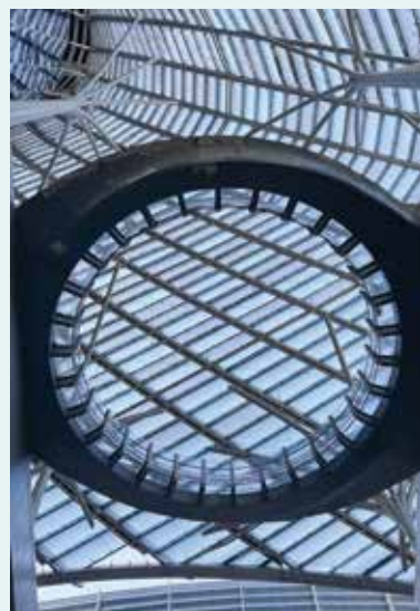
▲個商場裏裏外外都佈滿了「圓」的設計。