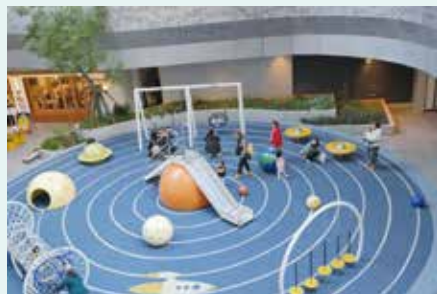
▲B1 有個兒童遊玩區域，太陽系八大行星的造型奪目繽紛，適合小朋友放電。