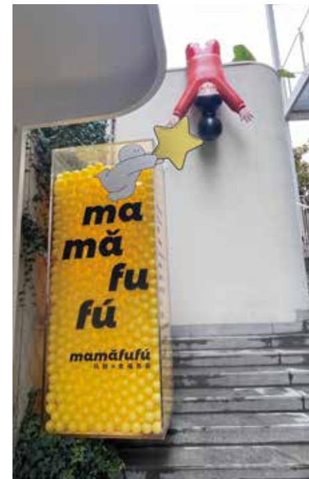
▲ 本來以為是甚麼外語，看清楚，不就是「馬馬虎虎」嗎？