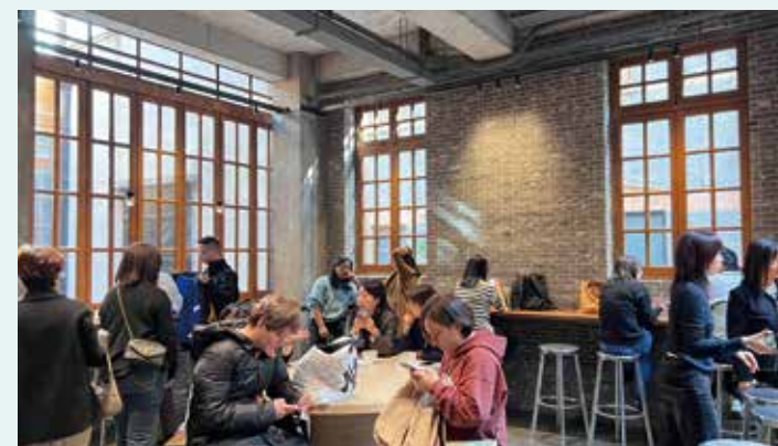
▲ 店內裝修走工業風路線，從窗框看到外面的張園已是最好的風景。

藍瓶咖啡走極簡主義，專注於咖啡本身。記得數年前在加州喝過一次之後，非常難忘，藍色瓶子的標記亦非常容易辨識。品牌憑着其獨特口味，獲得上海大批咖啡愛好者青睞，開業時絕對是「排隊王」，聞說要花上幾小時才等到一杯咖啡。張園店沾染着獨特的復古氣息，缺點是大部分時間排隊的人都比較多，需要點耐性。