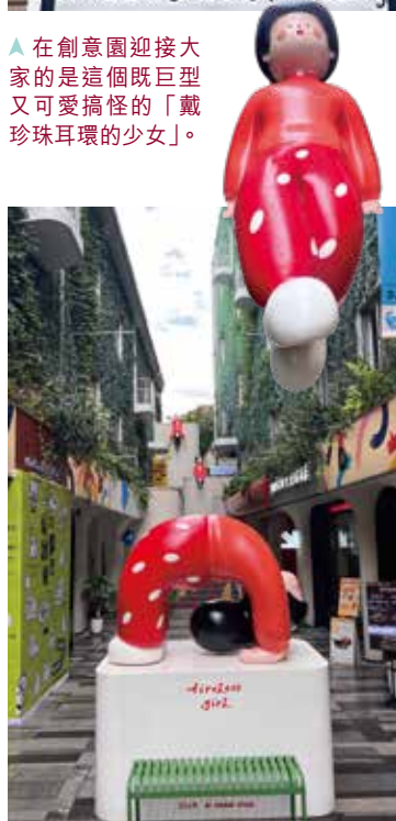
▲ 三個馬利女孩：下腰女孩、倒掛女孩、遠眺女孩，一直是打卡熱點。